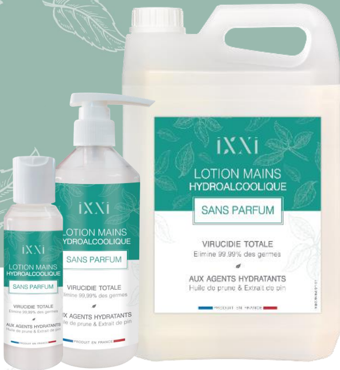
100mL : 5701 - 500mL : 5702 - Recharge 5L : 5703

Avec sa texture légère, cette Lotion Mains Hydroalcoolique s'évapore rapidement sans laisser de film gras ni collant. Sa formule désinfectante associe les vertus apaisantes de l'extrait de pin, aux propriétés hydratantes de l'huile de prune biologique (1) et du squalane végétal pour une douceur à l'application.