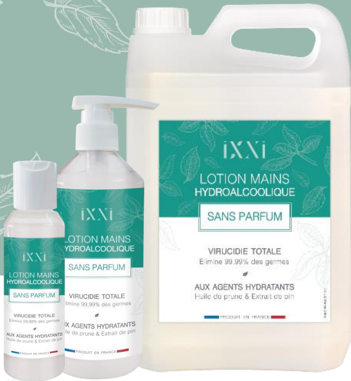
100mL : 5701 - 500mL : 5702 - Recharge 5L : 5703

Avec sa texture légère, cette Lotion Mains Hydroalcoolique s'évapore rapidement sans laisser de film gras ni collant. Sa formule désinfectante associe les vertus apaisantes de l'extrait de pin, aux propriétés hydratantes de l'huile de prune biologique (1) et du squalane végétal pour une douceur à l'application.